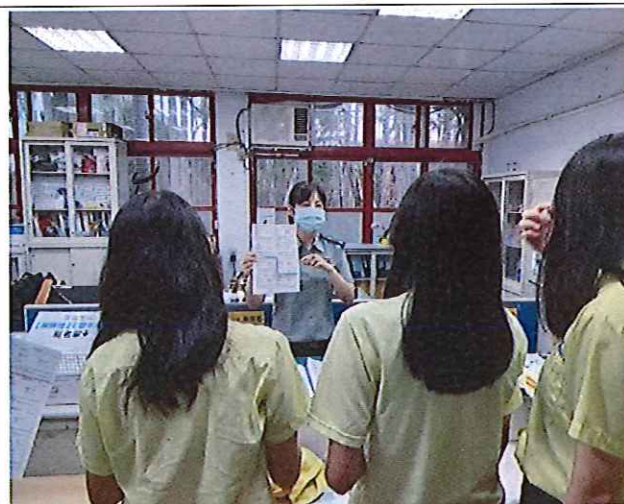
班長集合(生輔組實施家庭防災卡填寫說明)