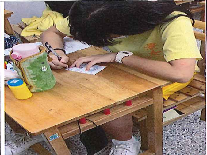
各班學生認真填寫-家庭防災卡。